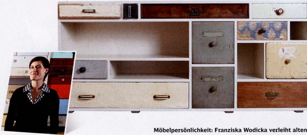
Möbelpersönlichkeit: Franziska Wodicka verleiht alten Schubladen neue Rahmen.

Was in armen Ländern pure Notwendigkeit ist, ruft hierzulande Designer auf den Plan: Möbel aus Müll sind mehr als ein Bekenntnis zur Nachhaltigkeit. In neuer Gestalt erfüllen sie auch hohe ästhetische Ansprüche - und stoßen im Markt auf reges Interesse.